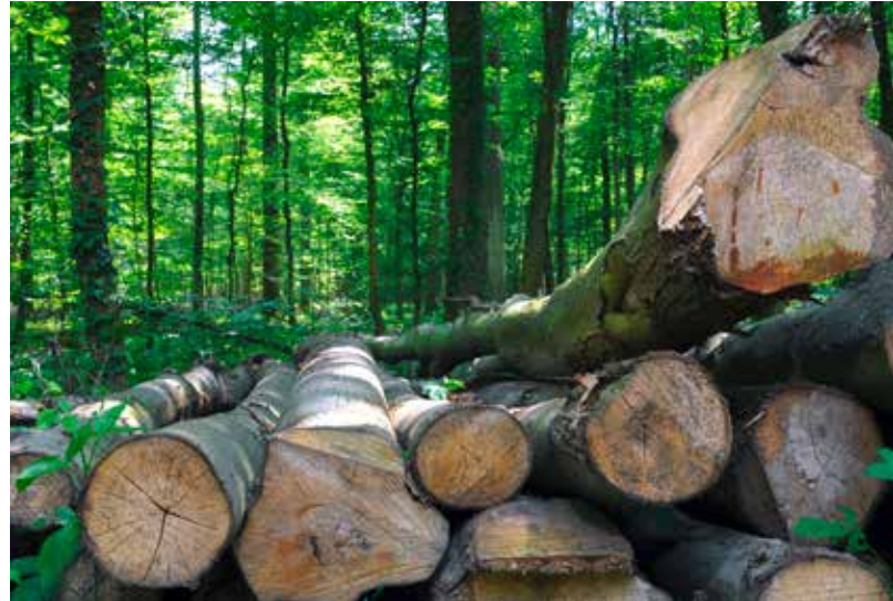
Die nachhaltige Forstwirtschaft ist 300 Jahre alt.

Entwicklungen aus allen Teilbereichen der Produktion. Als dritte Säule bietet Media Mundo über ausgesuchte Partner direkte Unterstützung bei der Entwicklung und Umsetzung wirksamer Nachhaltigkeitsstrategien.